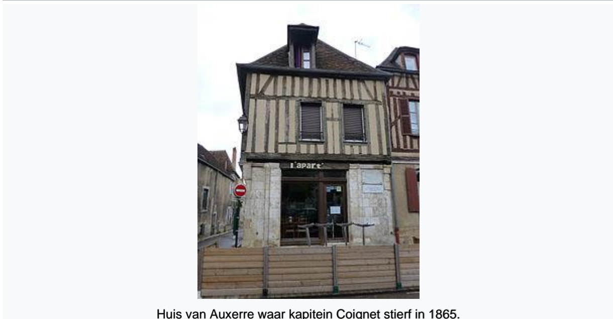
Huis van Auxerre waar kapitein Coignet stierf in 1865.

Jean-Roch Coignet werd geboren in Druyes-les-Belles-Fontaines , departement Yonne, de 16 augustus 1776 . Een arm kind, bijna aan zichzelf overgelaten, hoewel de zoon van een herbergier, Coignet werd ingelijfd in 1799 .